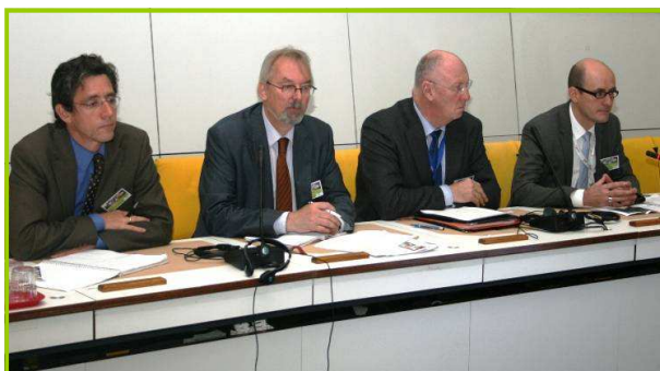
1. Szekció - előadók

A céljai közé tartozik a környezeti hatások csökkentése, a törvényi megfelelésség elősegítése és az adminisztratív terhek csökkentése. Az új direktíva szándéka szerint, a gyűjtési célok minden országra vonatkozóan megváltoztatásra kerültek; amellyel a nem megfelelően kezelt e-hulladékok miatti eltéréseket kívánják kiküszöbölni. A törvény továbbá tartalmazni fog újrahasználati célokat is és törekszik az eljárási folyamatok összehangolására.